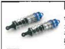
Vorderer Big Bore Stoßdämpfer Ø 16 mm Art.-Nr. 205722