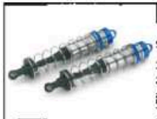
Hinterer Big Bore Stoßdämpfer Ø 16 mm Art.-Nr. 205727