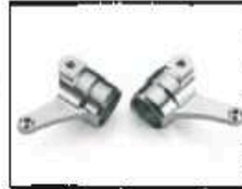
Alu-Lenkhebel CNC gefräst VA Art.-Nr. 205724