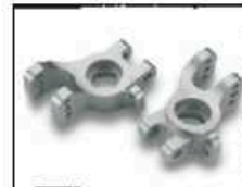
Alu-Radträger CNC gefräst HA Art.-Nr. 205725