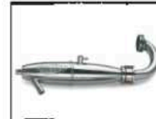
Power Pipe Chrom Art.-Nr. 905071