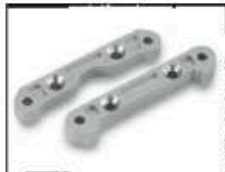
Alu-Querlenkerhalter vorne Art.-Nr. 205716