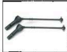
Kardanwellen Art.-Nr. 205734