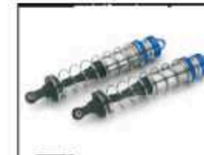
Stoßdämpfer vorne/ hinten Ø 16 mm Art.-Nr. 205727