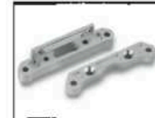
Alu-Querlenkerhalter hinten Art.-Nr. 205723