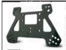
Carbon Dämpferbrücke hinten Art.-Nr. 205504