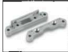
Alu-Querlenkerhalter hinten Art.-Nr. 205723