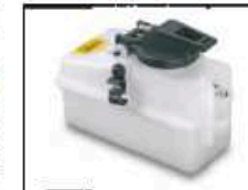
Tank 150 ccm Art.-Nr. 205731