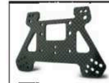
Carbon Dämpferbrücke hinten Art.-Nr. 205504