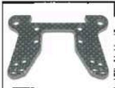
Carbon Dämpferbrücke vorne Art.-Nr. 205505