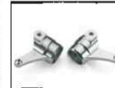
Alu-Lenkhebel CNC gefräst VA Art.-Nr. 205724