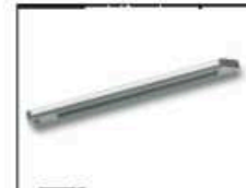
Chassisversteifung hinten Art.-Nr. 205730