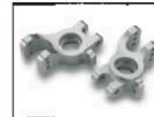
Alu-Achsschenkel Pro (CNC) Art.-Nr. 205725