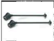
Kardanwellen mitte Art.-Nr. 205515